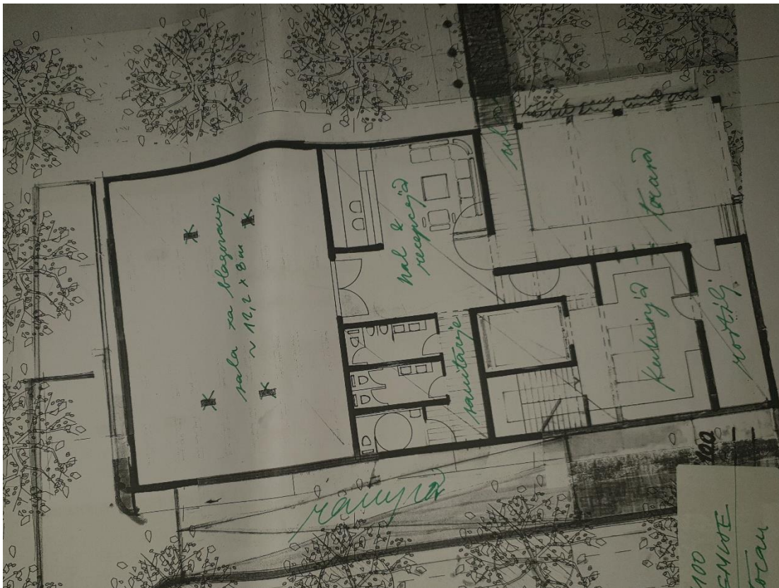
Slika 2.2. Restoran

Kako je prema Pravilniku o razvrstavanju i kategorizaciji ugostiteljskih objekata u kojima se pružaju ugostiteljske usluge na obiteljskom poljoprivrednom gospodarstvu (NN 54/2016) propisano da objekti na poljoprivrednom gospodarstvu moraju pružati usluge pripremanja i posluživanja hrane i pića, uz smještajne objekte zamišljen je restoran koji će biti opremljen za pružanje tih usluga. Restoran će pružati uslugu prehrane te će se posluživati tradicionalna hrana za to podneblje, moći će se isprobati domaći suhomesnati proizvodi koji će se proizvoditi na gospodarstvu ali i proizvodi okolnih proizvođača. Usluga prehrane biti će uračunata u cijenu smještaja iz razloga što u neposrednoj blizini ne postoji drugi ugostiteljski objekt koji pruža te usluge. Ukoliko gosti budu htjeli sami pripremati hranu biti će im osigurani svi potrebni materijali. Restoran će posluživati doručak, ručak i večeru u dogovoru sa gostima. Plan restorana možemo vidjeti na slici 2.2. restoran.