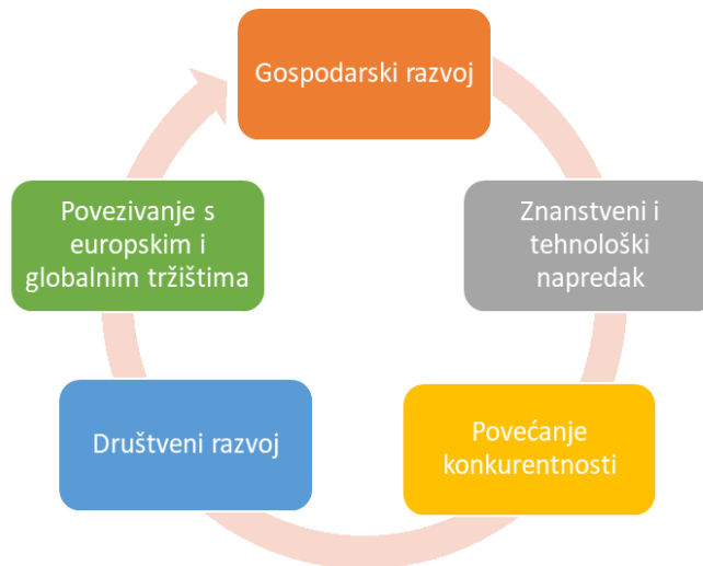
Slika 2.1. Prikaz dobrobiti koje proizlaze iz projekata IRI