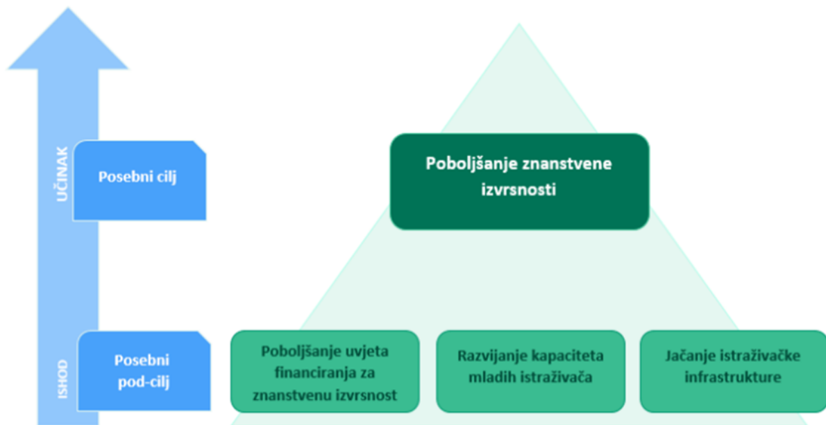
Slika 5.1. Strategija pametne specijalizacije - Posebni cilj 1