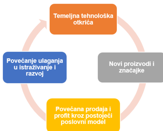
Slika 4.1. Uspješan krug ulaganja