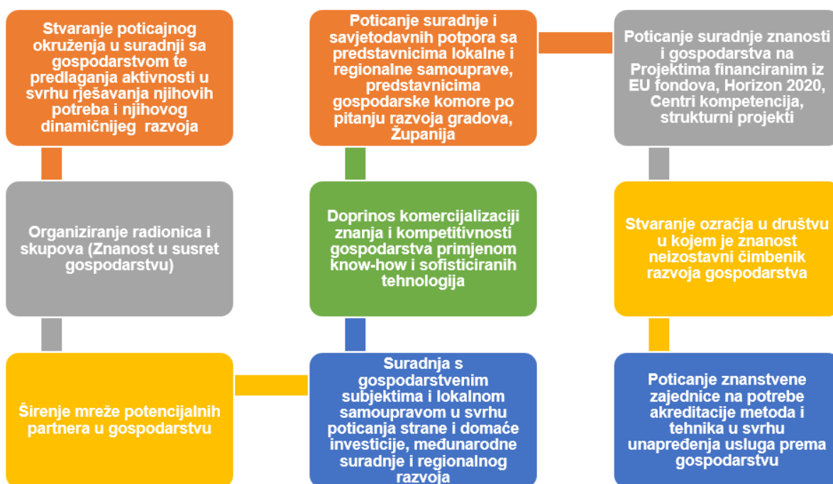
Slika 3.2. Djelokrug rada Savjeta za gospodarstvo