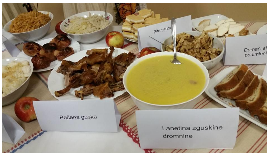
Slika 4.13. Pečena guska i hladetina od guske uz razne priloge

U današnje vrijeme guska dolazi na stol kao pečenka pretežito za blagdane i to posebno za Sve Svete, Martinje, Božić ili Novu godinu. Porijeklo tih gusaka najčešće je iz velikih trgovačkih centar. Rijetki su oni koji uspiju nabaviti gusku sa sela koja se pasla na livadi ili plivala u kakvome potoku ili obližnjoj bari. Pečena guska s kestenima ili mlincima i mlado vino osebujni je hrvatska specijalitet koji se jede samo u hrvatskome narodu, čak i kad je dijaspora u pitanju, primjerice u Slovačkoj. U odnosu na drugu perad, meso gusaka ima nešto manji udio bjelančevina i znatno veći udio masti. U krajevima uz rijeku Savu guske su se sušile i dimile u komadu. Poznato je da se gusku znalo ispeći i spremiti u mast te se koristiti po potrebi.