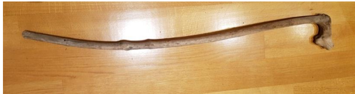
Slika 4.7. Palica za kotakanje

Kotakanje je tradicijska igra koja se igra isključivo na području Novoga Čiča te okolnih sela (Jagodno, Ribnica, Lazina Čička). Nigdje u drugim dijelovima Turopolja nitko ne spominje kotakanje. Organizacijski gledano igra je najbližnja današnjem hokeju. Igra se uvijek na Uskršnji ponedjeljak u poslijepodnevno vrijeme nakon ručka (obeda). Pripreme kreću već nekoliko tjedana unazad kad se odlazilo u šumu. Tamo se odabire odgovarajuće drvo koje ima palicu u kosom obliku slova L. Najčešće se koristilo drvo klena ili brijesta radi svoje tvrdoće. Sa palice se ogulila kora i prosušila se da bude lakša i tvrđa. Kao "pak" se koristio poprečno odrezani komada drveta od neke oblice, dok je u današnje vrijeme aktualna gumena inačica paka.