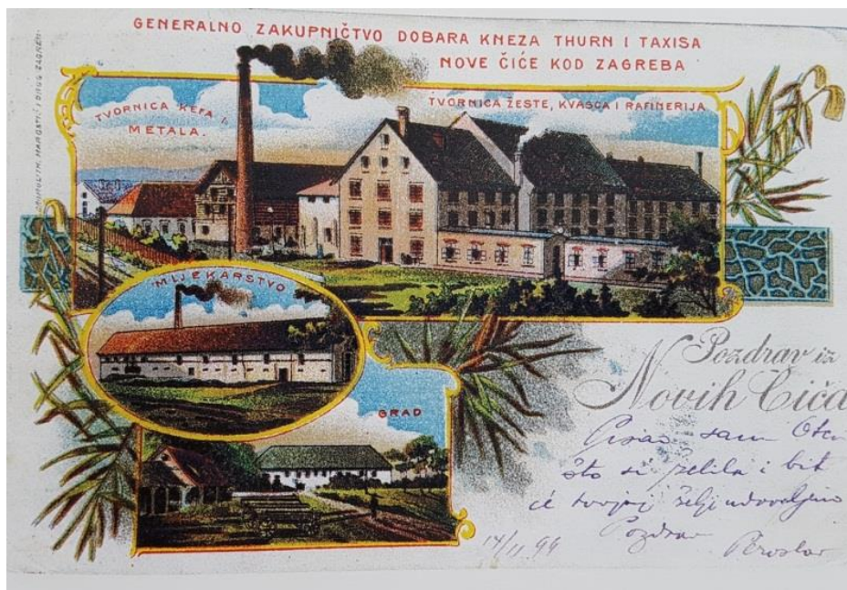
Slika 4.2. Razglednica iz 1899. godine