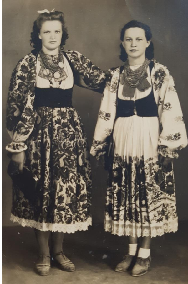
Slika 4.8. Narodna nošnja iz Novog Čiča

ili više stilizirani. Česti su motivi cvjetna kitica, sama ili u ritmičkom ponavljanju te ljudski i životinjski likovi. Motivi i boje imaju simbolično, apotropejsko ili magijsko značenje. Jarkocrvena boja je predviđena isključivo za mlade i za vrlo svečane i vesele trenutke.