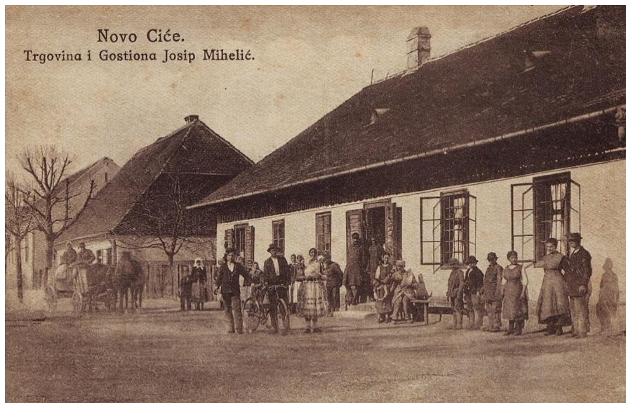
Slika 4.5. Razglednica trgovine i gostione, Novo Čiče

Razglednica je datirana 18.11.1912. godine. Nakladnik je Albert Gomerčić, fotograf iz Zagreba. Prikazuje tvornicu pjenice, špirita i metli posjednika Thurn und Taxisa. Tvornica je imala više desetaka radnika koji su u sklopu tvornice proizvodili i osnovne sirovine za preradu: sirak, ječam i kukuruz.