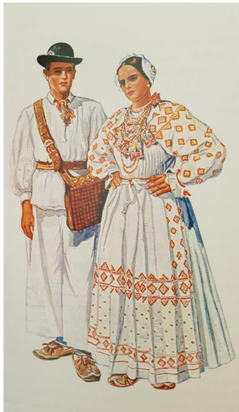
Slika 4.9. Narodna nošnja iz Novog Čiča