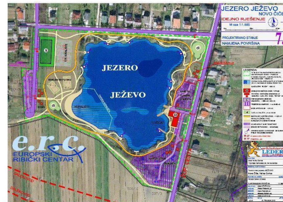
Slika 4.1. Ježevo jezero