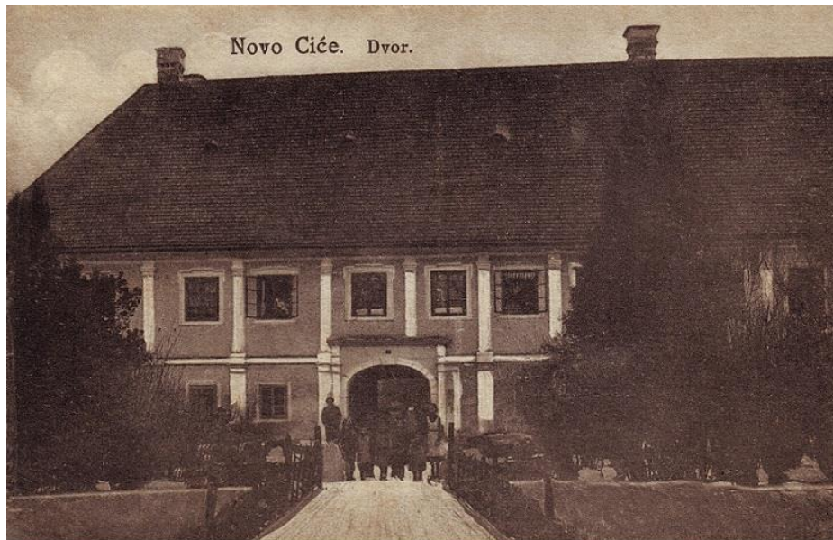
Slika 4.3. Razglednica Dvor, Novo Čiče