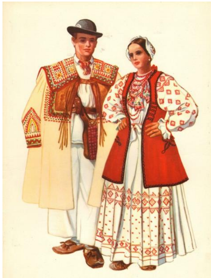
Slika 4.10. Narodna nošnja iz Novog Čiča