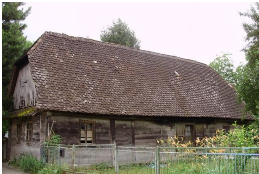
Slika 4.12. Tradicijska prizemnica iz 1838. godine u vlasništvu autorove obitelji

Novo Čiče je u svojoj prošlosti imalo veliki broj drvenih prizemnica (hiža) i čardaka. Danas postoji mali broj tih kuća, dok se drveni čardak nije očuvao niti jedan (Mlinar i Čiča, 2010). Obitelj autora je vlasnik jedne drvene prizemnice. Kuća potječe iz prve polovice 19. stoljeća i na glavnoj gredi (tramu) urezana je godina gradnje 1838. godina. Godine 2016. nakon očevida konzervatora iz Ministarstva kulture donesena je sljedeća odluka: “Kuća je tradicijska zgrada koje se valorizira kao vrlo vrijedna zbog graditeljskih i stilskih obilježja sredine 19. stoljeća. Zbog činjenice da stare drvene zgrade imaju svojstva prostorne, tehničke i arhitektonske baštine kao i zbog duboke tradicije, dio su sveukupnog hrvatskog identiteta te ih treba čuvati od propadanja“.