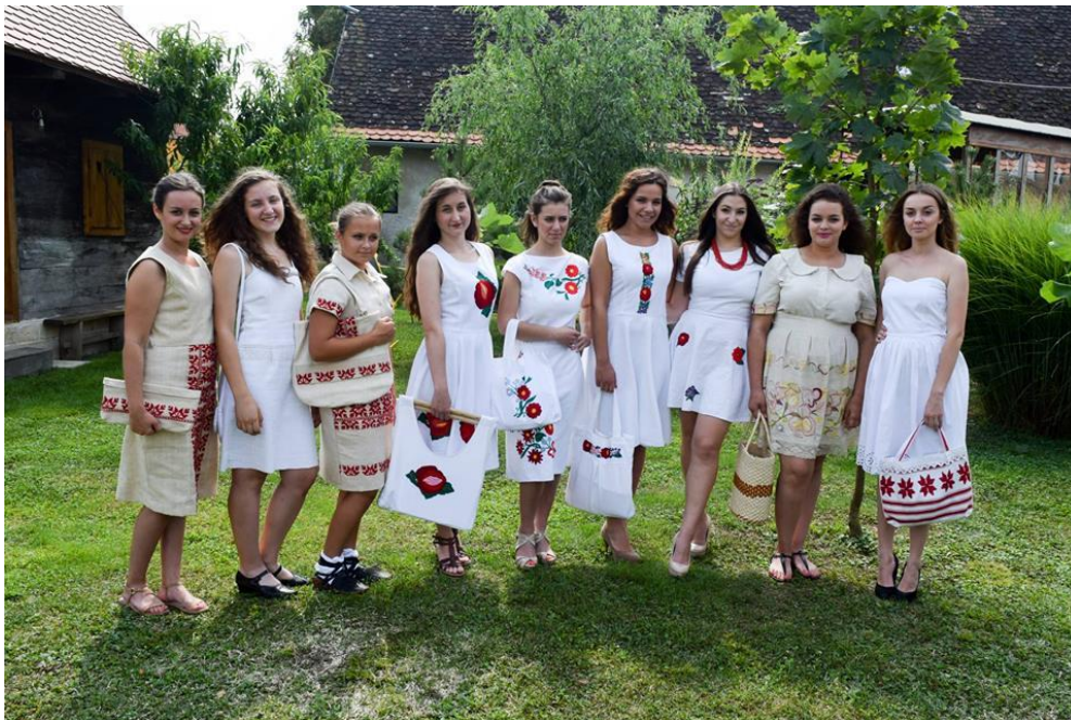
Slika 4.11. Članice KUD-a "Čiče" u lanenim haljinama