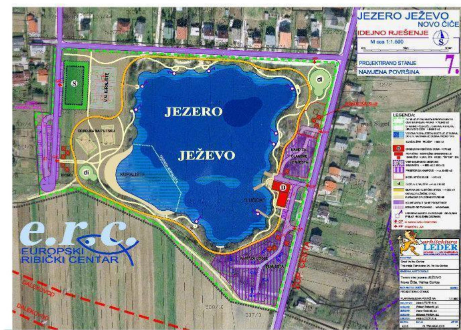
Slika 4.1. Ježevo jezero