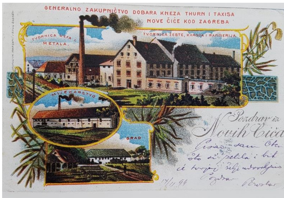
Slika 4.2. Razglednica iz 1899. godine