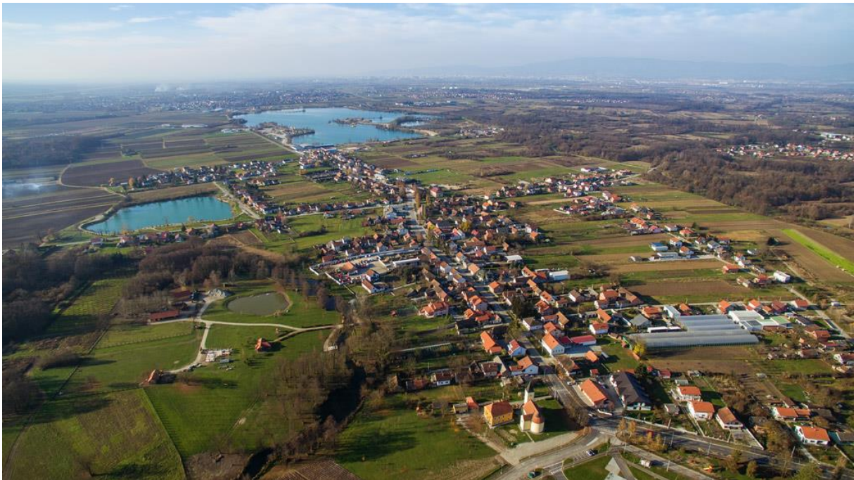
Slika 2.1. Panorama mjesta Novo Čiče