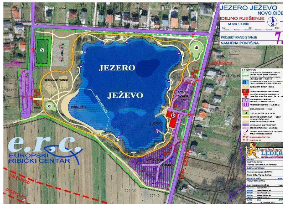
Slika 4.1. Ježevo jezero