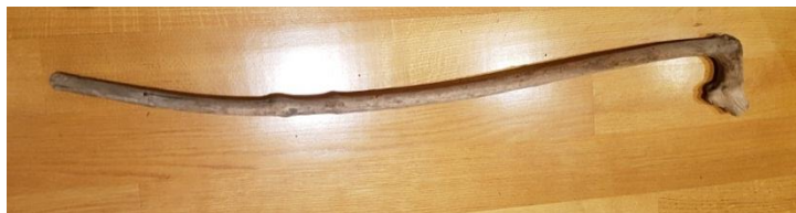
Slika 4.7. Palica za kotakanje

Kotakanje je tradicijska igra koja se igra isključivo na području Novoga Čiča te okolnih sela (Jagodno, Ribnica, Lazina Čička). Nigdje u drugim dijelovima Turopolja nitko ne spominje kotakanje. Organizacijski gledano igra je najbližnja današnjem hokeju. Igra se uvijek na Uskršnji ponedjeljak u poslijepodnevno vrijeme nakon ručka (obeda). Pripreme kreću već nekoliko tjedana unazad kad se odlazilo u šumu. Tamo se odabire odgovarajuće drvo koje ima palicu u kosom obliku slova L. Najčešće se koristilo drvo klena ili brijesta radi svoje tvrdoće. Sa palice se ogulila kora i prosušila se da bude lakša i tvrđa. Kao "pak" se koristio poprečno odrezani komada drveta od neke oblice, dok je u današnje vrijeme aktualna gumena inačica paka.