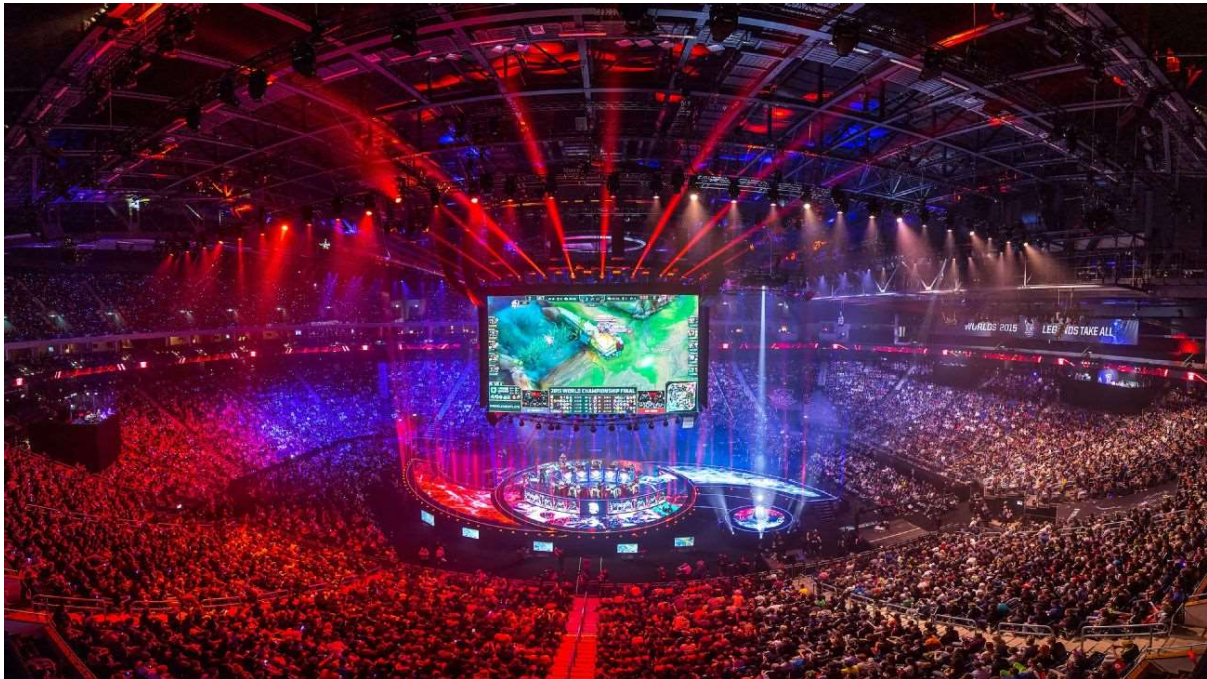
Slika 2.1. Dvorana za vrijeme održavanja svjetskog prvenstva u „ League of Legendsu “