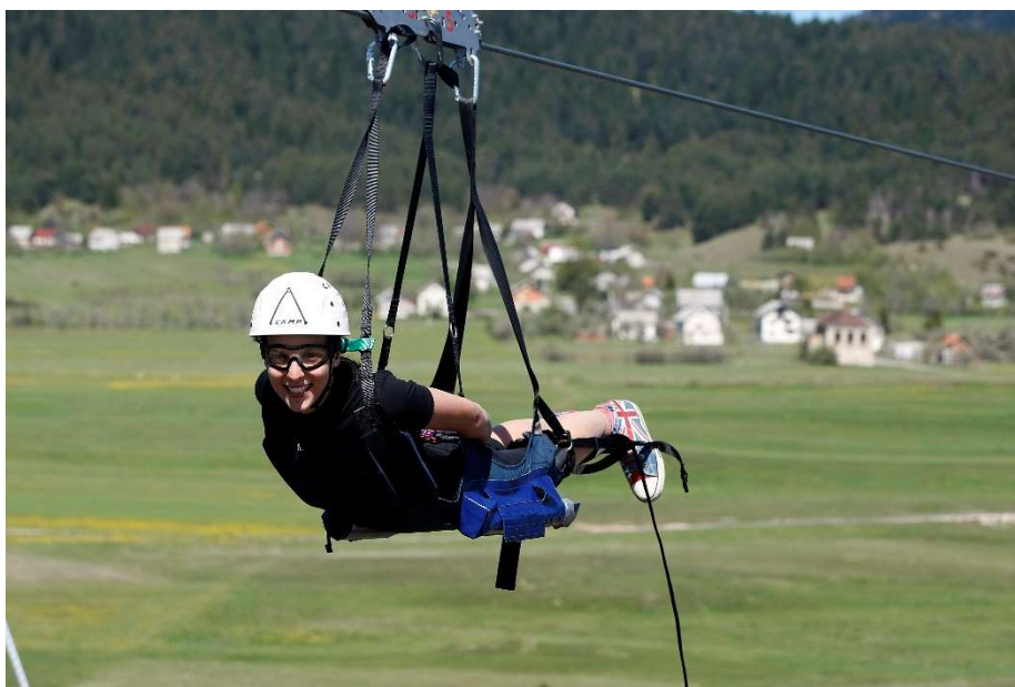
Slika 4.1. Zipline „Pazi Medo“