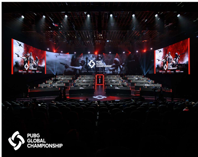
Silka 2.2. Dvorana za vrijeme svjetskog natjecanja u igri PuBG 2019.godine