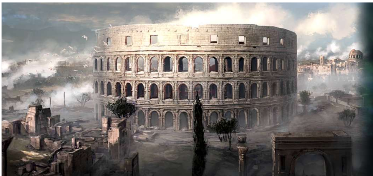
Slika 2.4. Rimski Kolosej redizajniran unutar igre Assassins Creed: Brotherhood

S obzirom na ranije navedeno kako se lokacije e-sport turnira unaprijed određuju, turizam i gaming industrija mogu biti usko povezane. Primjer povezanosti gaming industrije i samog turizma je franšiza igre "Assassins Creed", gdje su developeri igre bili inspirirani napraviti igru koja se temelji na stvarnim događanjima, ali uz dodatak fiktivnih dijelova, radi interesantnosti priče i na temelju stvarnih lokacija, uzimajući u obzir povijesne karte i činjenice. Serijal igre trenutno ima 12 glavnih nastavaka s popratnih sedam sporednih nastavaka, koji se uklapaju u cjelokupni koncept igre. 6 Na primjeru nastavka igre pod imenom "Assassins Creed: Brotherhood", radnja cijele igre odvija se u Rimu, u vrijeme renesanse u Italiji. Glavni negativac u cijeloj igri je korumpirani Papa Borgia, poznatiji pod imenom Aleksandar VI. Igrači igre postali su sve više zainteresirani posjetiti lokacije koje su prikazane u igri, kao npr. Rimski Kolosej (Slika 2.4.), Bazilika sv. Petra i sl., jer ih je prvenstveno zanimalo kako sada ta lokacija izgleda usporedno s onim što su vidjeli u igri. 7