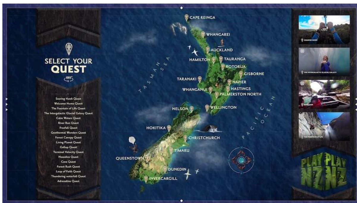
Slika 2.5. Geografska karta igre “ Play NZ ”