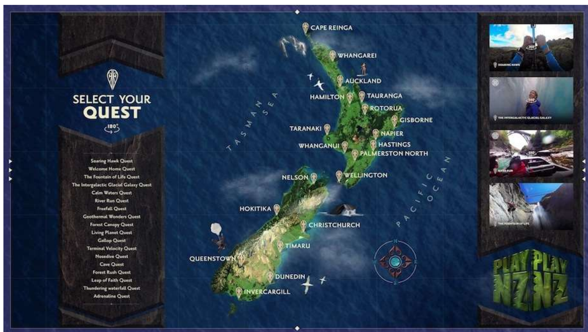
Slika 2.5. Geografska karta igre „Play NZ”