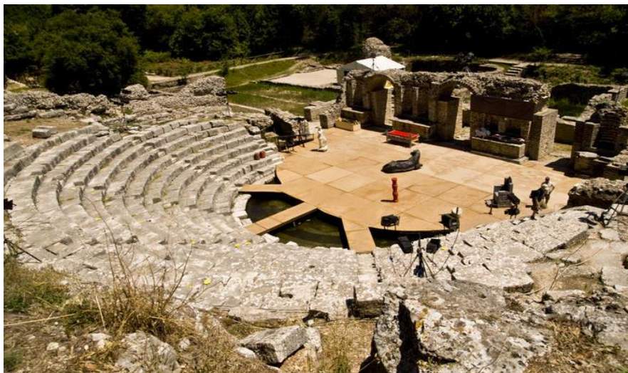
Slika 5.2.1. Amfiteatar u Butrintu