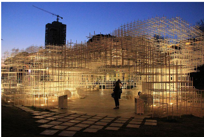
Slika 6.3.3. Nacionalna umjetnička galerija u Tirani