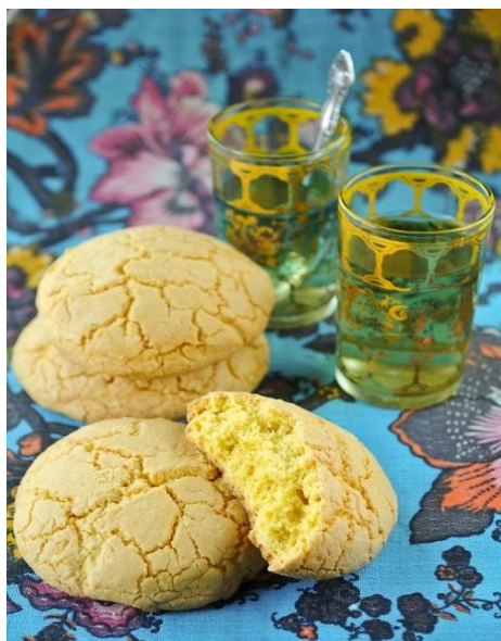
Slika 6.2. 1. Ballokumja