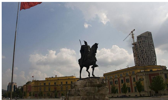
Slika 6.3. 2 Skenderbegov trg u Tirani