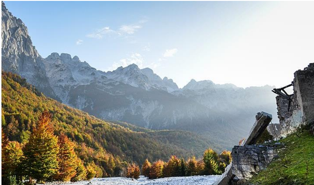
Slika 6.1.2. Nacionalni park Valbona