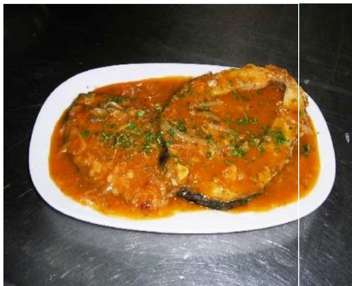
Slika 6.2. 2. Tava e Krapit