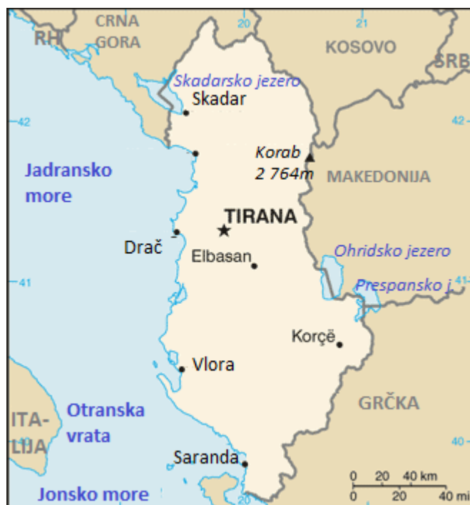
Slika 5.1.1. Opća karta Albanije

Preuzeto s: https://legacy.lib.utexas.edu/maps/albania.html (1. 2. 2018.)