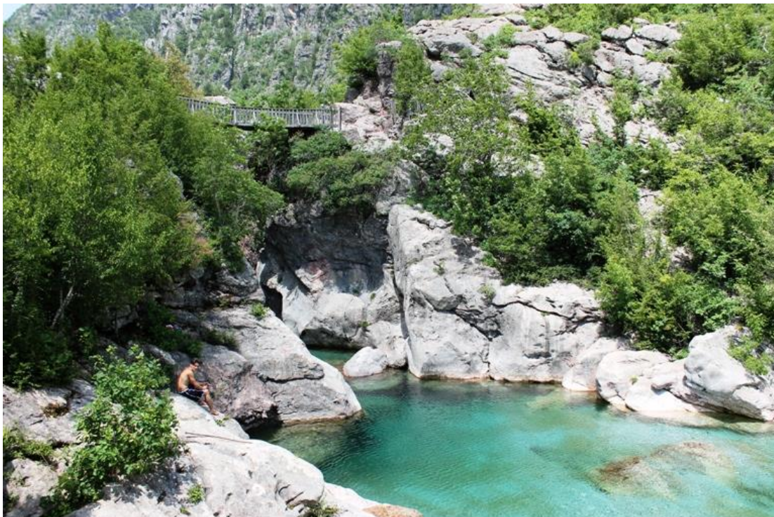
Slika 6.1.3. Nacionalni park Theth