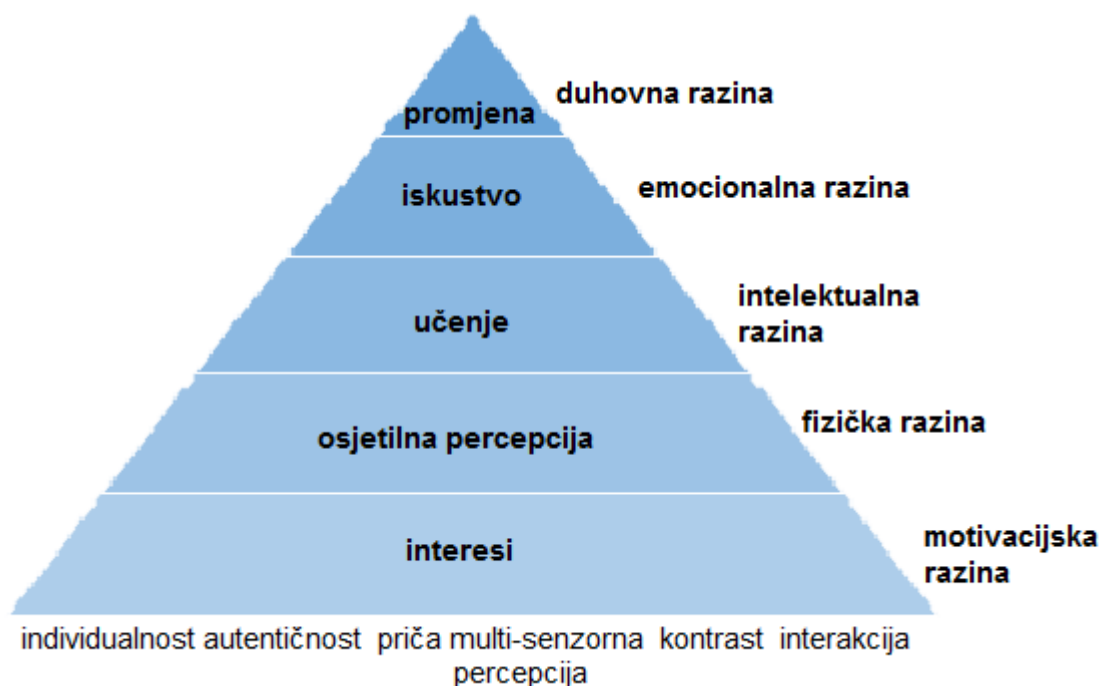
Slika 6.3.1. Piramida iskustva