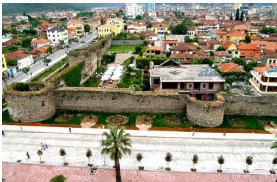
Slika 6.3.3. Elbasan – panorama iz zraka