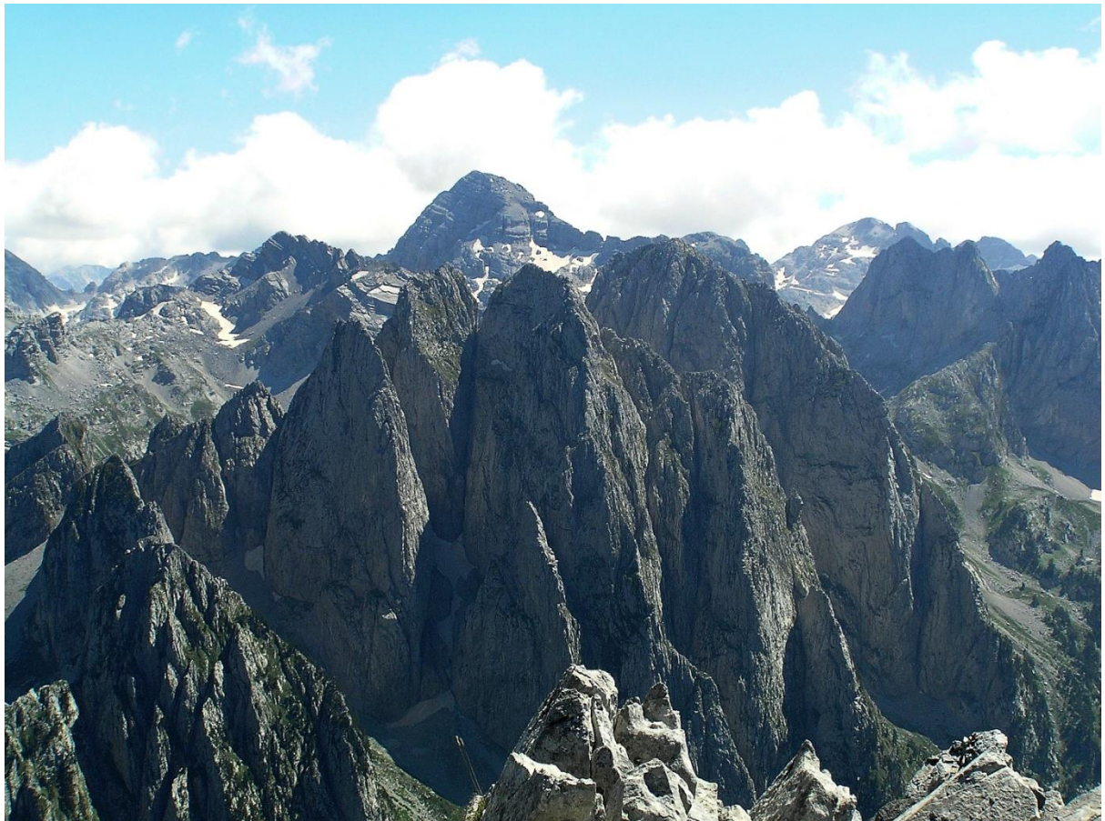
Slika 6.1.1. Albanske Alpe, Jezerski vrh