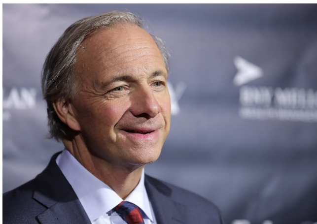
Slika 4.4. Ray Dalio

Montag, A. (2.1.2019.) Power players: Billionaire Ray Dalio shares a 3-step formula for anyone to start investing. CNBC . Preuzeto s: https://www.cnbc.com/2019/01/02/ray-dalio-shares-formula-anyone-can-use-to-start-investing.html (31.10.2020.)