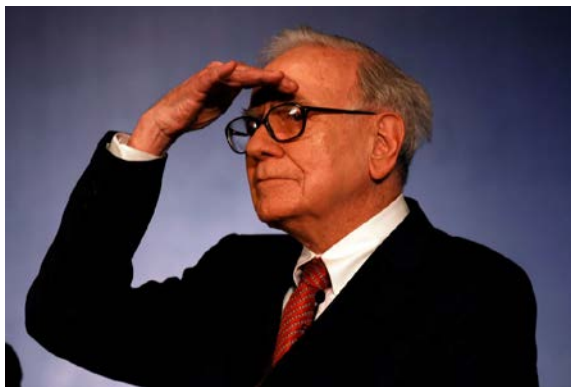
Slika 4.3. Warren Buffett