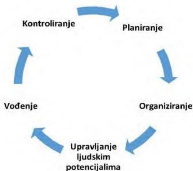
Slika 2.3. Ciklički prikaz menadžerskih funkcija