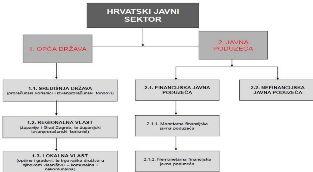
Slika 2.1. Podjela hrvatskoga javnog sektora