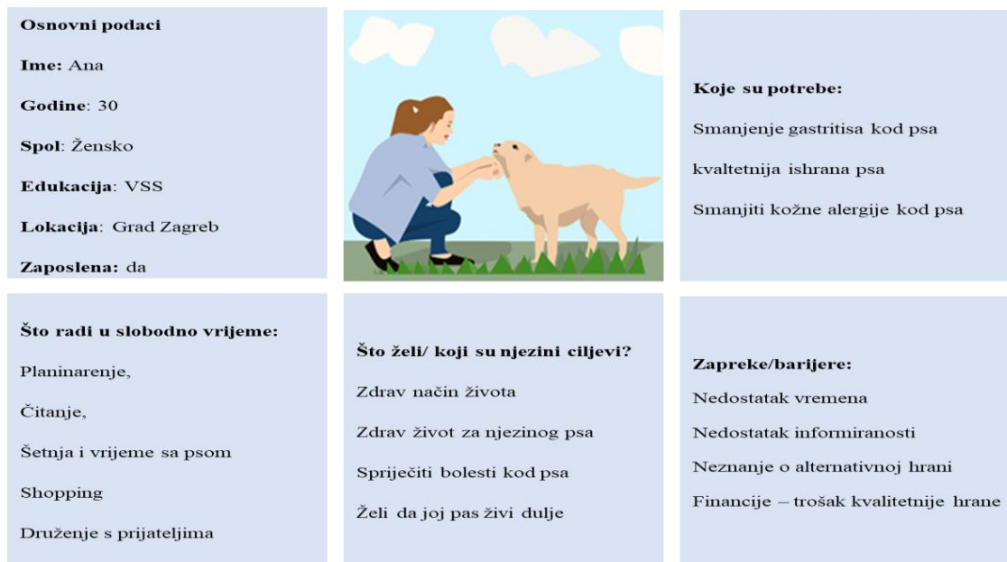
Slika 3.1.: Određivanje ciljanog kupca

Izvor: Vlastita izrada autora, prema Udacity 12