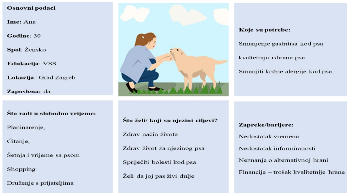
Slika 3.1.: Određivanje ciljanog kupca