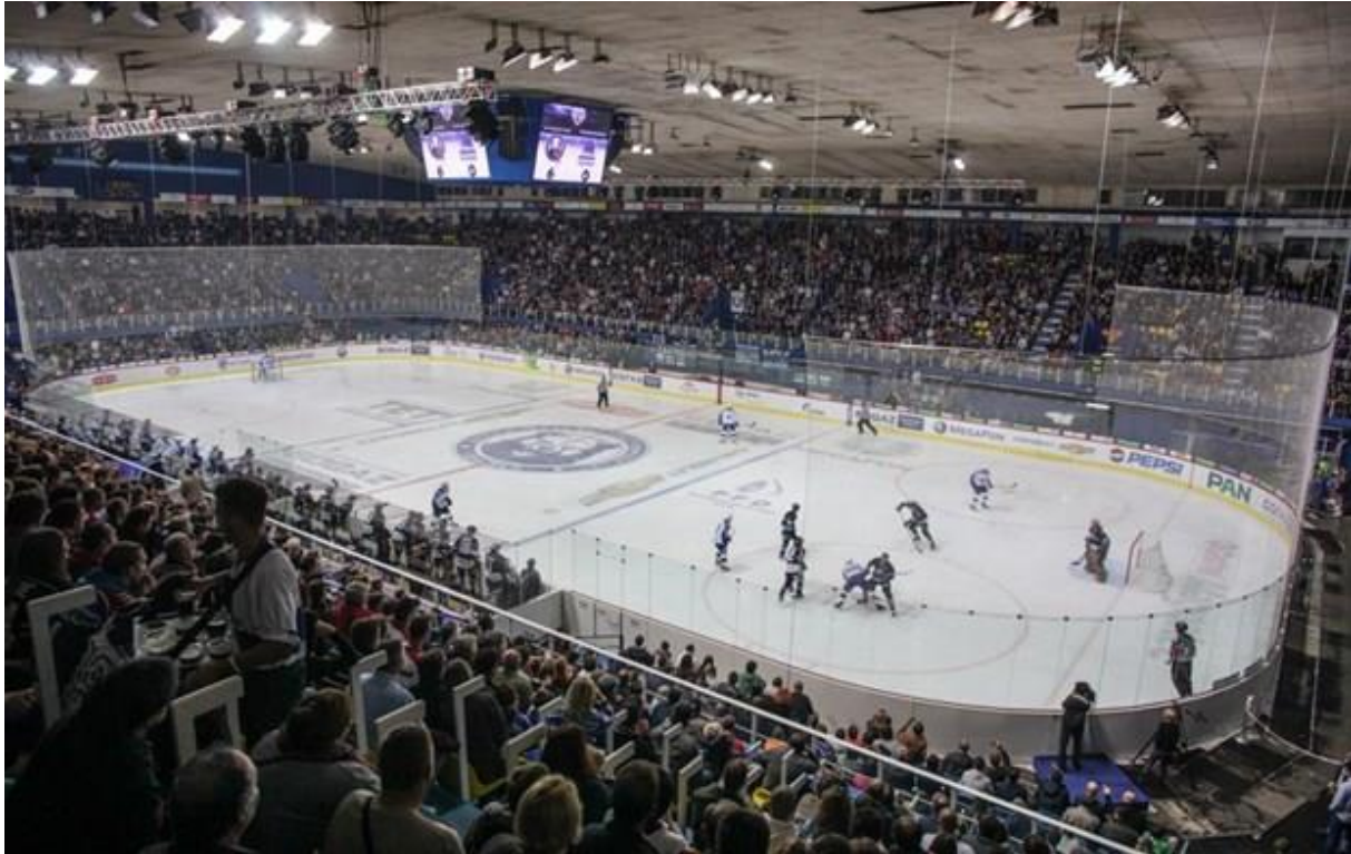
Slika 5.1. Gledatelji na utakmici KHL Medveščaka u Domu sportova