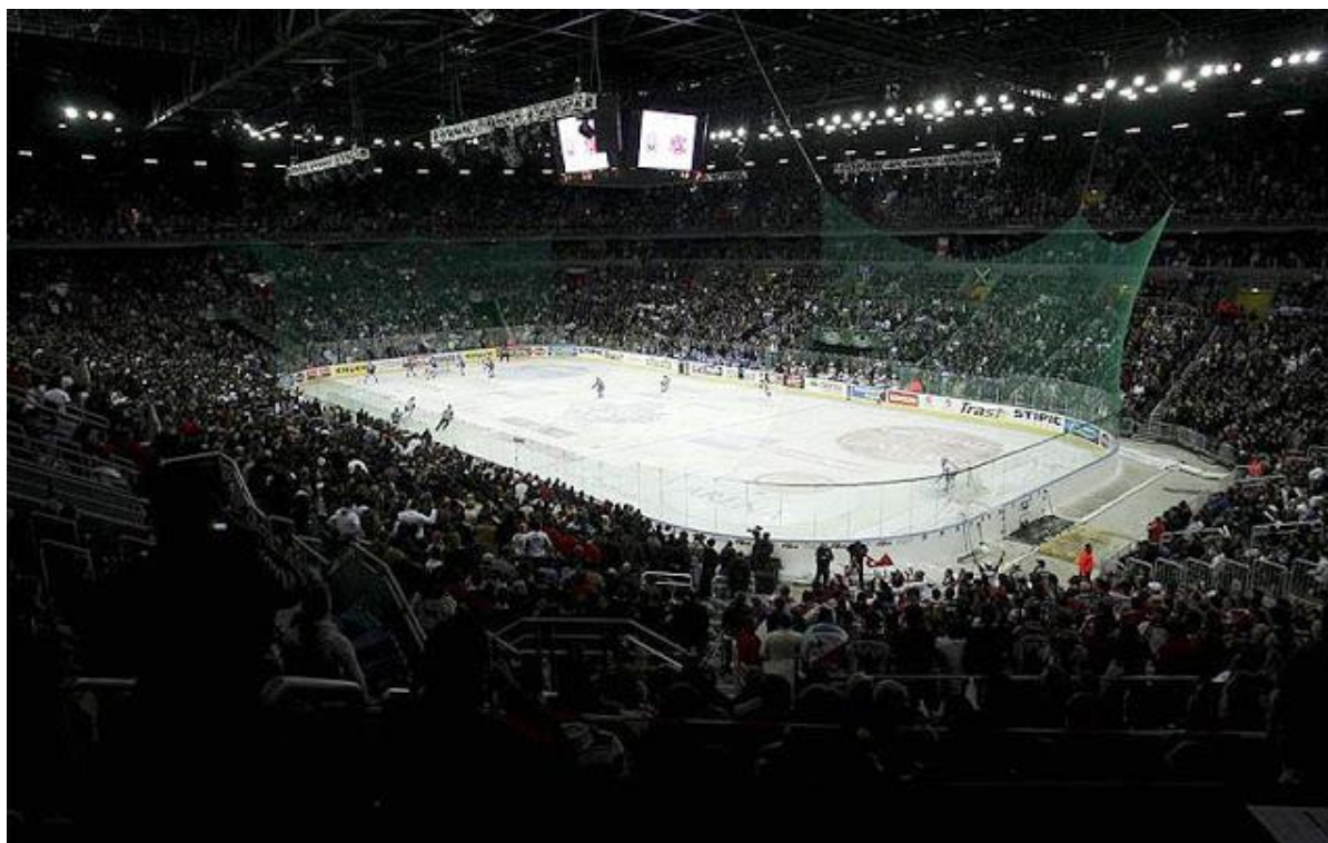
Slika 3.4. Nastup Medveščaka na manifestaciji Arena Ice Fever