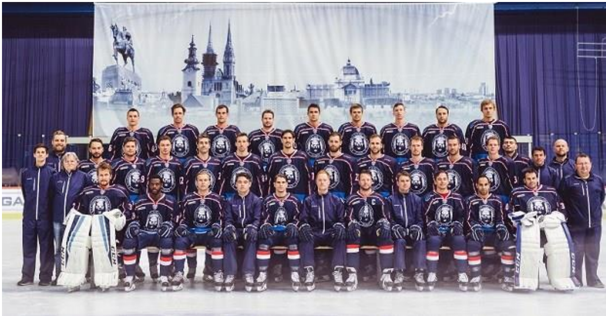
Slika 3.3. Momčad KHL Medveščak