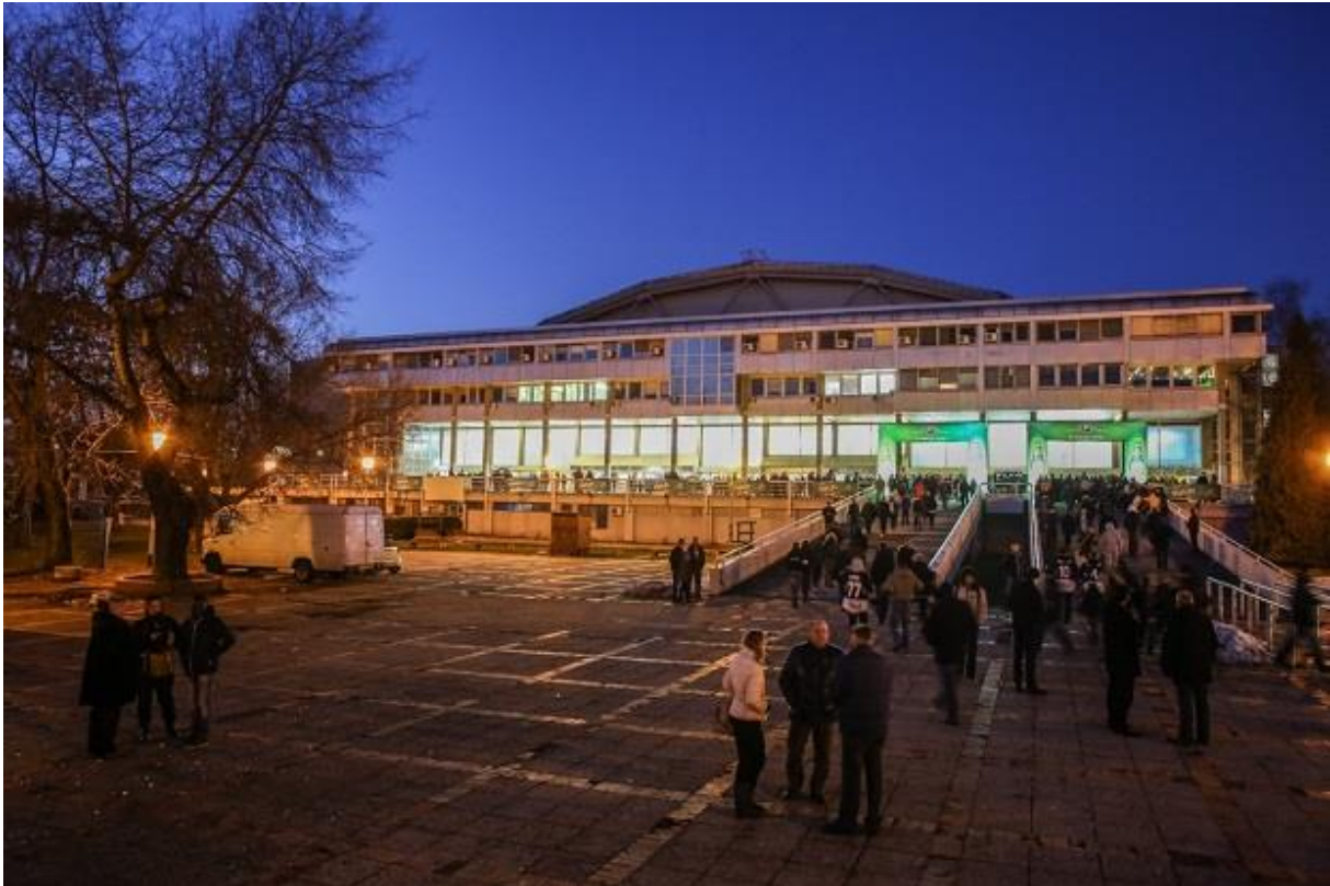
Slika 3.1. Dom sportova