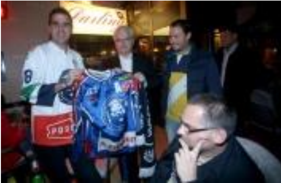
Slika 5.4. Predsjednik Republike Hrvatske, dr.sc. Ivo Josipović s navijačima