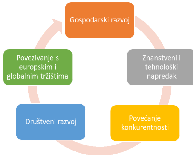
Slika 2.1. Prikaz dobrobiti koje proizlaze iz projekata IRI