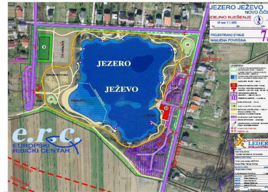
Slika 4.1. Ježevo jezero