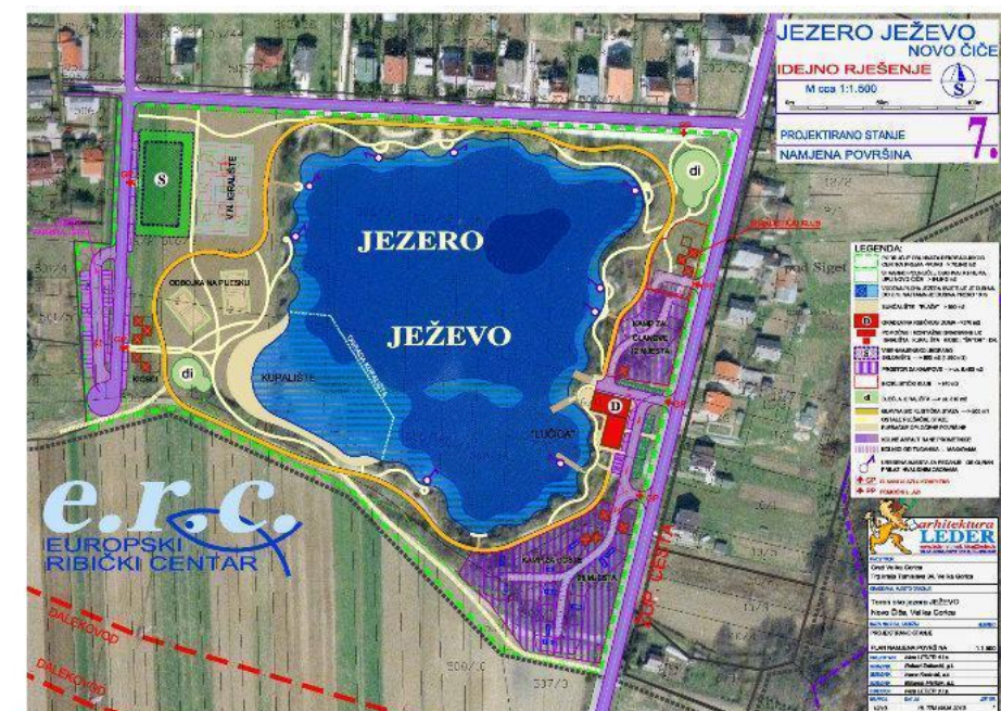
Slika 4.1. Ježevo jezero