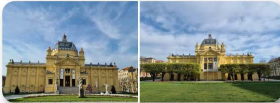
Slika 5.1. Umjetnički paviljon u Zagrebu