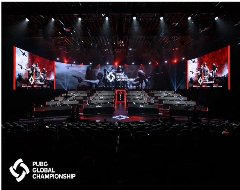
Silka 2.2. Dvorana za vrijeme svjetskog natjecanja u igri PuBG 2019.godine