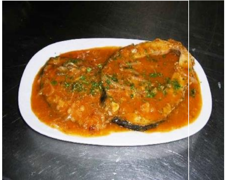
Slika 6.2. 2. Tava e Krapit