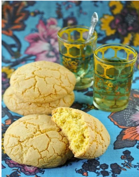
Slika 6.2. 1. Ballokumja