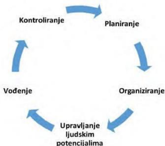
Slika 2.3. Ciklički prikaz menadžerskih funkcija