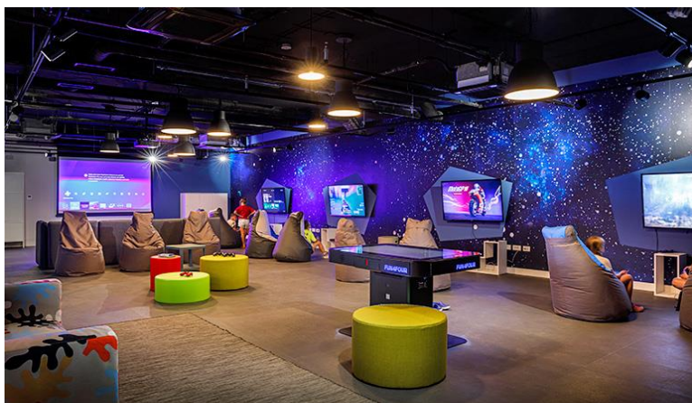
Slika 4.1. Fun zone s videoigrama