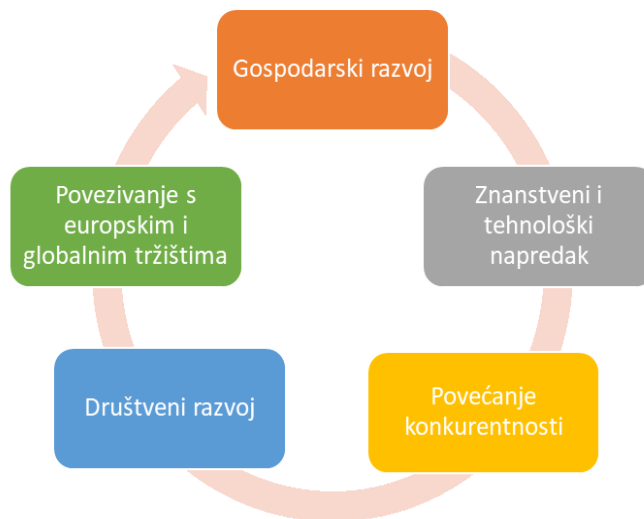
Slika 2.1. Prikaz dobrobiti koje proizlaze iz projekata IRI