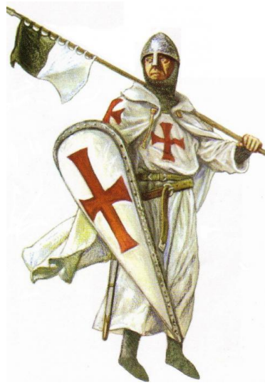
Slika 2.3. Odore križara za vrijeme Križarskog rata