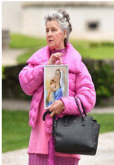
Slika 4.1. Fotografija s prosvjeda Hod za život i korištenje vjerskih simbola