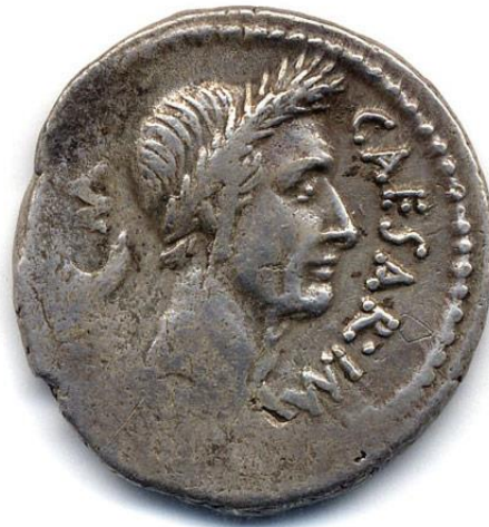
Slika 2.1. Kovanica s likom Julija Cezara