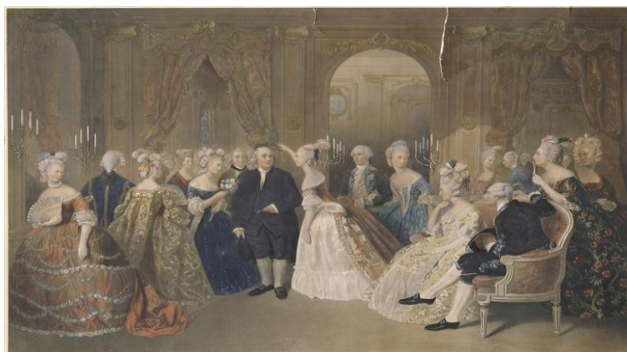
Slika 2.1. Prvi catering događaj u Americi